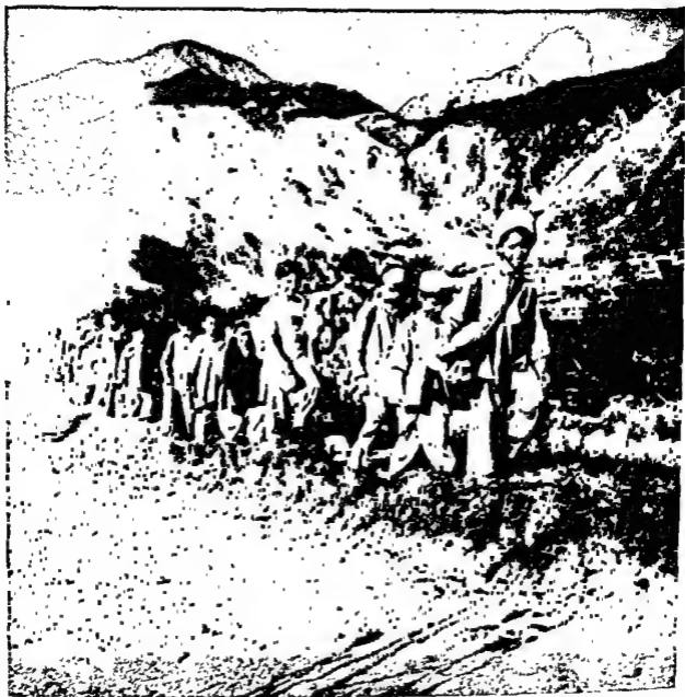
प्रगति की ओर